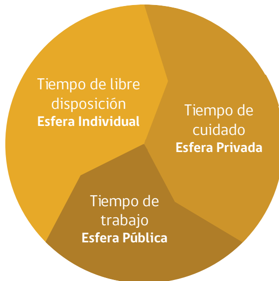
Diagrama N°1 Los tiempos a conciliar.

Desde esta mirada, cuando se habla de conciliación no se debe limitar sólo al mundo del trabajo, hay otros elementos de la vida pública y privada que merecen ser considerados, como por ejemplo: los horarios de atención de los servicios, horarios escolares, tiempos de traslado, tiempo libre, entre otros.