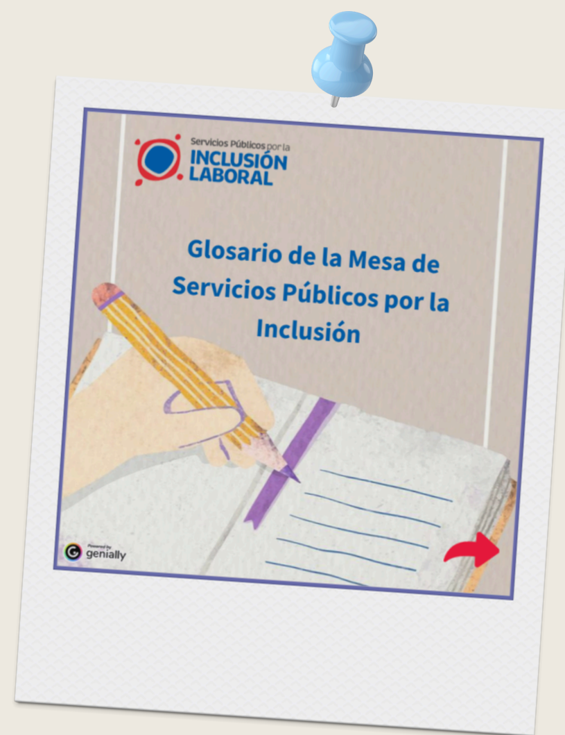
Imagen muestra captura de pantalla de la portada de Glosario de la Mesa de Servicios Públicos por la Inclusión, que contiene la ilustración de una libreta y una mano sosteniendo un lápiz.

Dentro de las acciones comunicacionales impulsadas por la Mesa, este año desarrollamos un Glosario interactivo donde puedes encontrar conceptos asociados con la inclusión laboral de personas con discapacidad, de la A a la Z. Haz click aquí para conocer el glosario